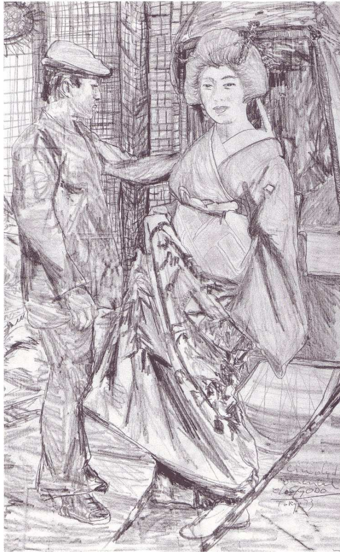
"Geisha y Taxista " punta de plomo sobre papel, 32x45 cm. Tokyo 1973

Look here: http://www.elggodo.net/en/ or/o Mirar aqui: http://www.elggodo.net/es/