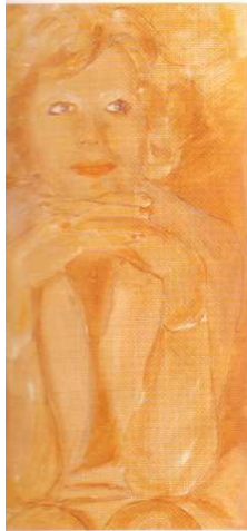
"Polaca", acrílico Hamburg 1974

entendimiento solamente en comerciales o profesiones