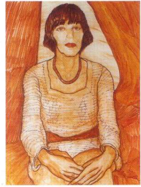
"Michelle", tinta. Canada 1976

El experimento de El.GGoDo, por último, viene a derribar la torre en que se han encasillado, constituidos en élite, los expertos en arte: una torre desde la cual ellos, únicos poseedores de la verdad, miran desdeñosamente al público degustador de arte estimándole como grey a la que ellos tienen que guiar.