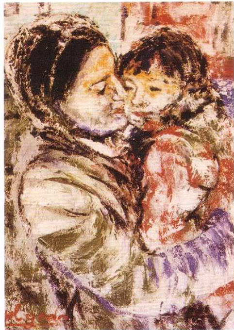
"Maternidad" óleo, Lienzo. León 74. 82x65cm.

incluso las de minimas criaturas animales. Y efectivamente, el tema maternal se repite en la obra de, El.GGoDo, con una ternura que culmina en una Maternidad, entonada en azulencos y con desgarrada dicción, en la que son poemáticas las expresiones de inefable arrobamiento de la madre y el hijo: una obra excepcional que por su representatividad ha sido solicitada por la UNICEF en la Conmemoración del "Año Internacional del Niño".