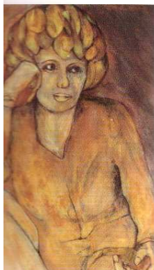
"Polaca" óleo, Hamburg 75

entendimiento solamente en comerciales o profesiones