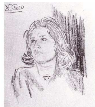
"Enedina", china-carbón. León 77

Concretandonos, ahora a la tónica del enjuiciamiento público de la obra de, El.GGoDo, deducible de la lectura de los comentarios que se han seleccionado, ordenandolos por las actividades profesionales de los enjuiciantes y que se transcriben en este libro como colofón del mismo, cabe afirmar rotundamente que la pintura de, El.GGoDo, admás de ser convin-